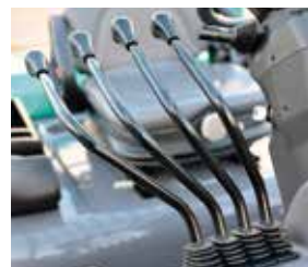
Cómodas palancas hidráulicas