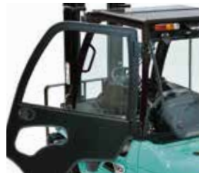
Cabina panelada PlusCab