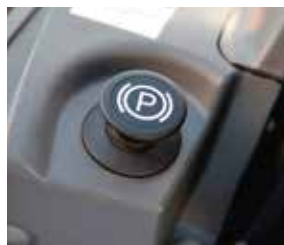
Ergonómico botón de freno de mano