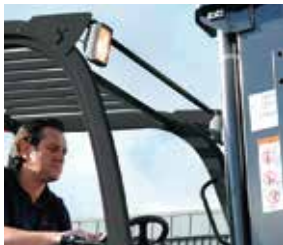
Luces de trabajo frontales LED