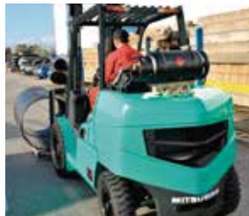
Diseño atractivo y robusto