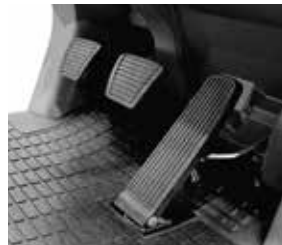
Pedales de estilo automóvil