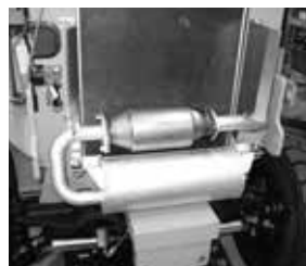
Tecnología LPG avanzada