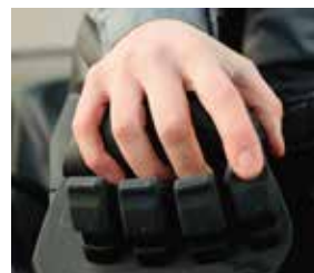
Controles hidráulicos mediante Fingertips (opcionales)